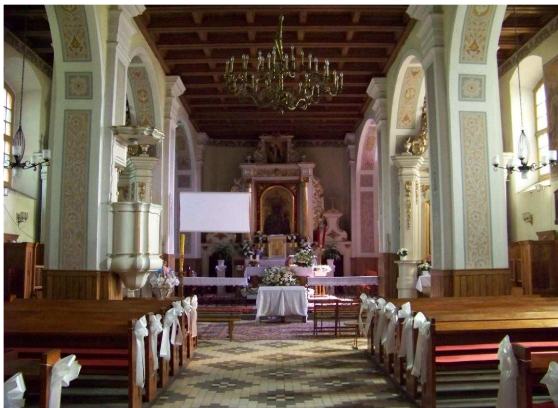
Wnętrze zabytkowego kościoła w Jezewie