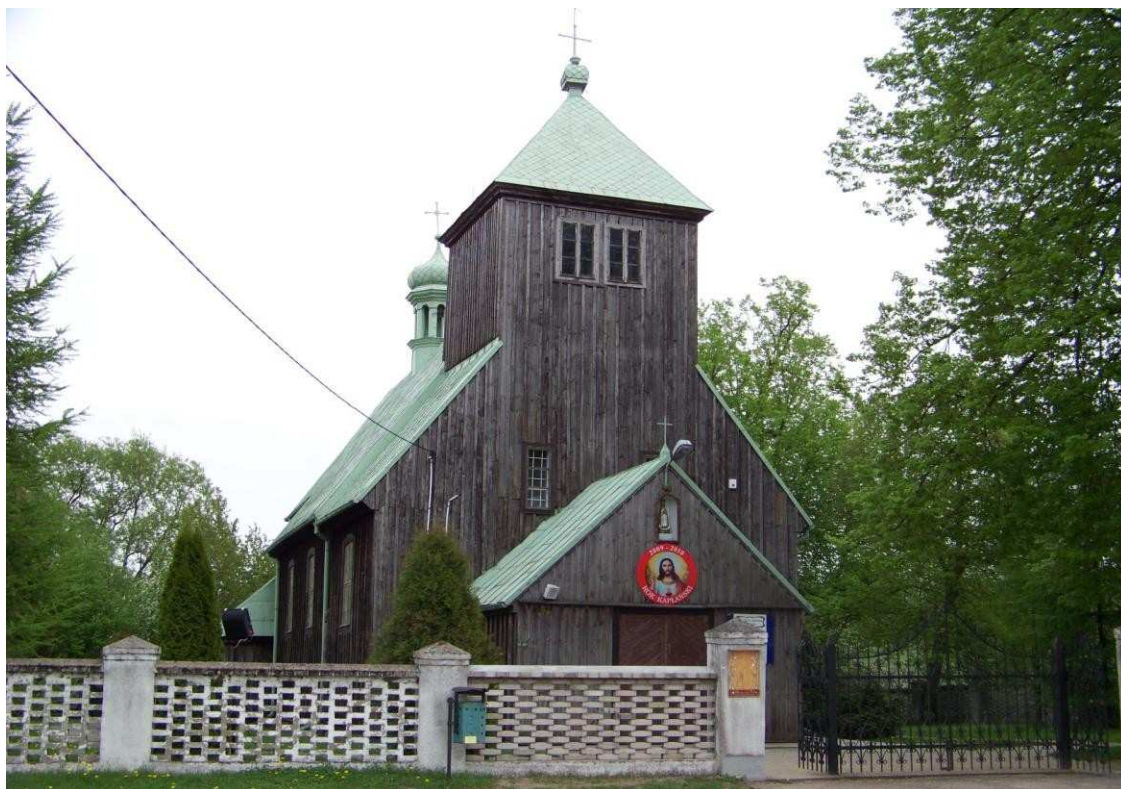
Kościół pw. św. Katarzyny w Łukomiu