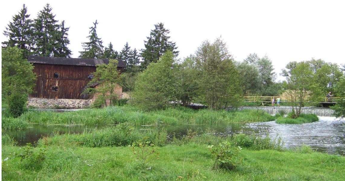
Zagroda młynarska w Choczeniu (młyn wodny na Skrwie)