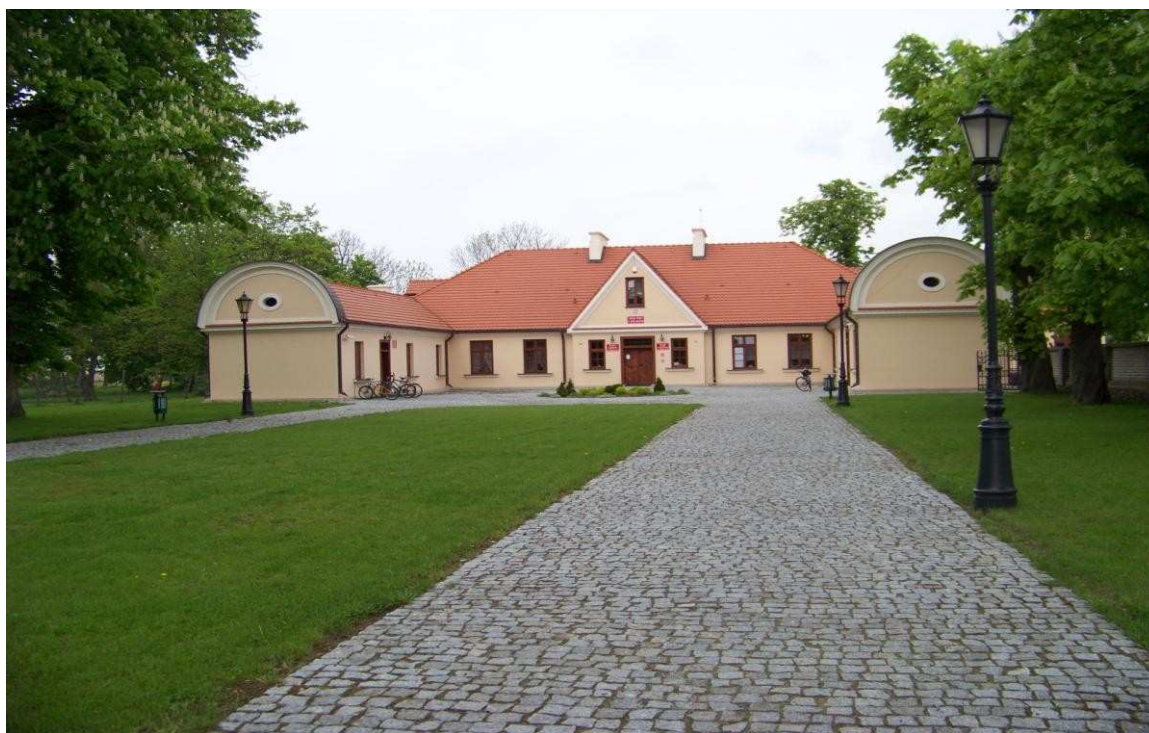
Zabytkowy dworek w Rościszewie