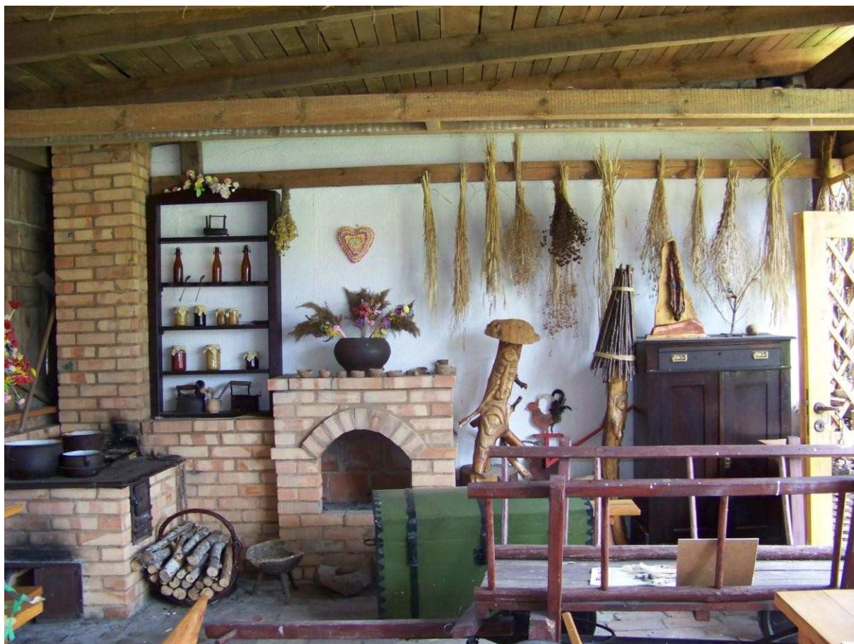
Wnętrze wiaty edukacyjnej przy Szkole Podstawowej w Ostrowach (działalność Grupy Odnowy Wsi „Nasze Ostrowy”)