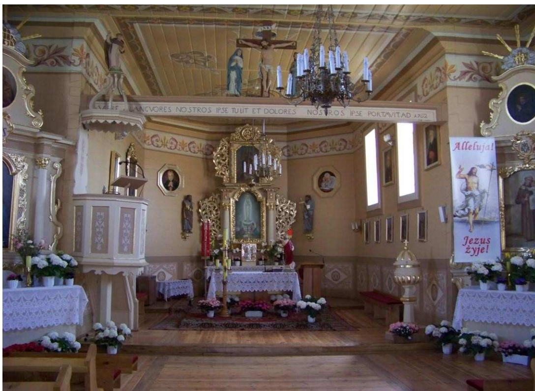
Wnętrze zabytkowego kościoła w Goleszynie