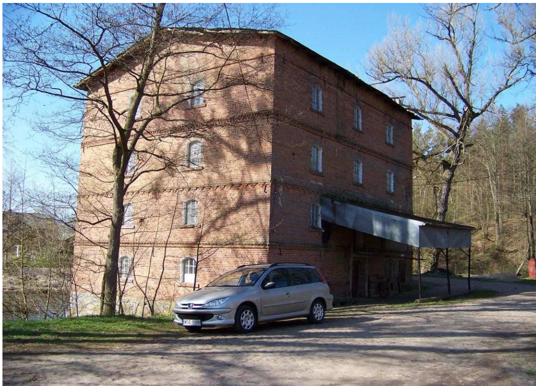
Zabytkowy młyn wodny w miejscowości Kwaśno