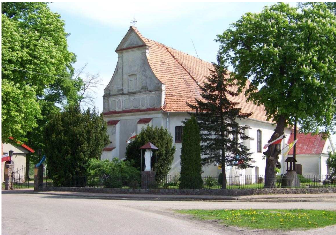
Zabytkowy kościół w Jezewie